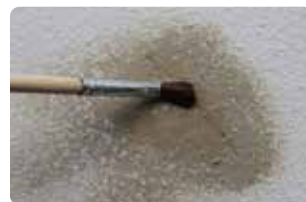
浅いキズなら刷毛や筆で均す。