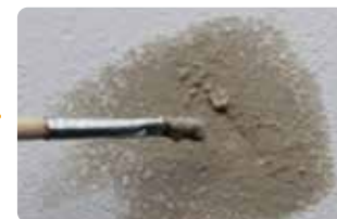
絵筆や指などを使ってキズに補修用粉を塗り、均していきます。