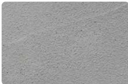
数回水を吹きかけた後、最後にティッシュに染み込ませたキッチン用漂白剤で、シミをたたきます。