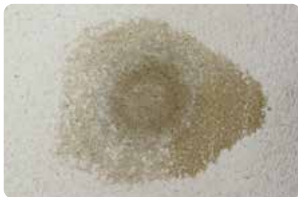
霧吹きで水を吹きかけ、シミを薄くしていきます。