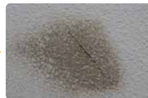
傷の周りを霧吹きで湿らせます。