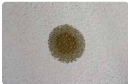
コーヒーのシミをキッチン用漂白剤を使って落としていきます。

水だけでも落とすことはできますが、キッチン用漂白剤を使用するとすぐに汚れを落とすことができます。