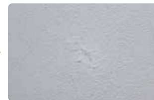
傷が目立たなくなりました。

車のタッチアップのようなイメージの仕上がりです。完全に戻すなら塗り直し（再施工）となります。